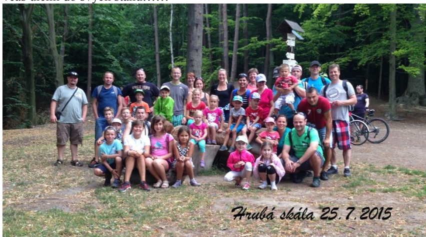
Hrubá skála 25. 7. 2015

Stanování s dětmi začalo v 8,00 hod. srazem na Debrském vlakovém nádraží, kde se odjelo směr Český ráj. Trasu dlouhou cca 9 km (Turnov- Hrubá Skála- Sedmihorky), pěšky zdolali všichni. Nejmladším účastníkům ještě nebyli ani 3 roky. Výletu se zúčastnilo dohromady 40 dětí a dospělých. V odpoledních hodinách jsme se přesunuli do sportovního areálu, kde se postavily stany a začaly soutěže pro děti, zakončené stezkou odvahy, diskotékou a grilováním. Výlet byl náročný a všichni včas ulehli do svých stanů.....