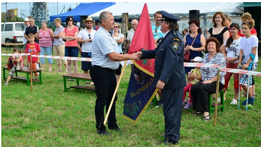
V rámci oslav 130. výročí Sboru dobrovolných hasičů v Hrdlořezích byla 29. srpna slavnostně předána starostou obce vlajka hasičům.

Vážení čtenáři, podle kalendáře už je tu opět podzim a s ním i podzimní vydání čtvrtletníku.