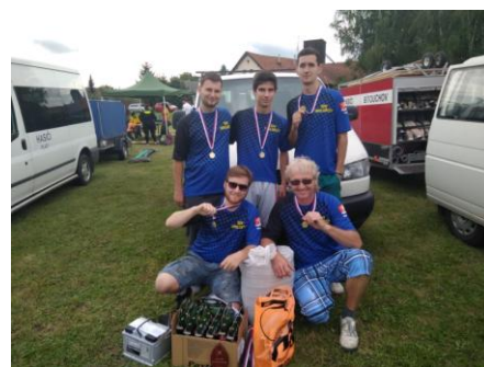
*účast zbytku týmu byla na extralize

Bítouchov: požární útok; muži B: 8. místo (29,15 s)